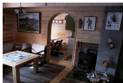
Hans & Grethe 6 sengeplasser