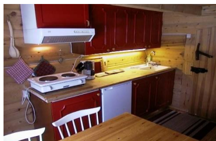
Stabburloft 2 sengeplasser