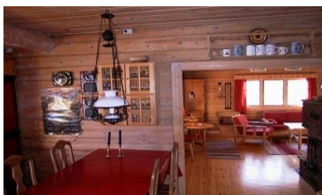
Tømmerhytta 8 sengeplasser, sauna Tilrettelagt for rullestolbruke

Priser fra kr 800,- til kr 1400,- pr døgn pluss sengetøy og utvask!