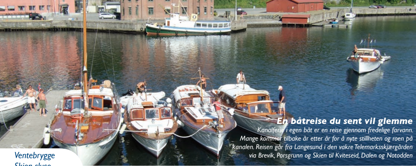
Ventebrygge Skien sluse