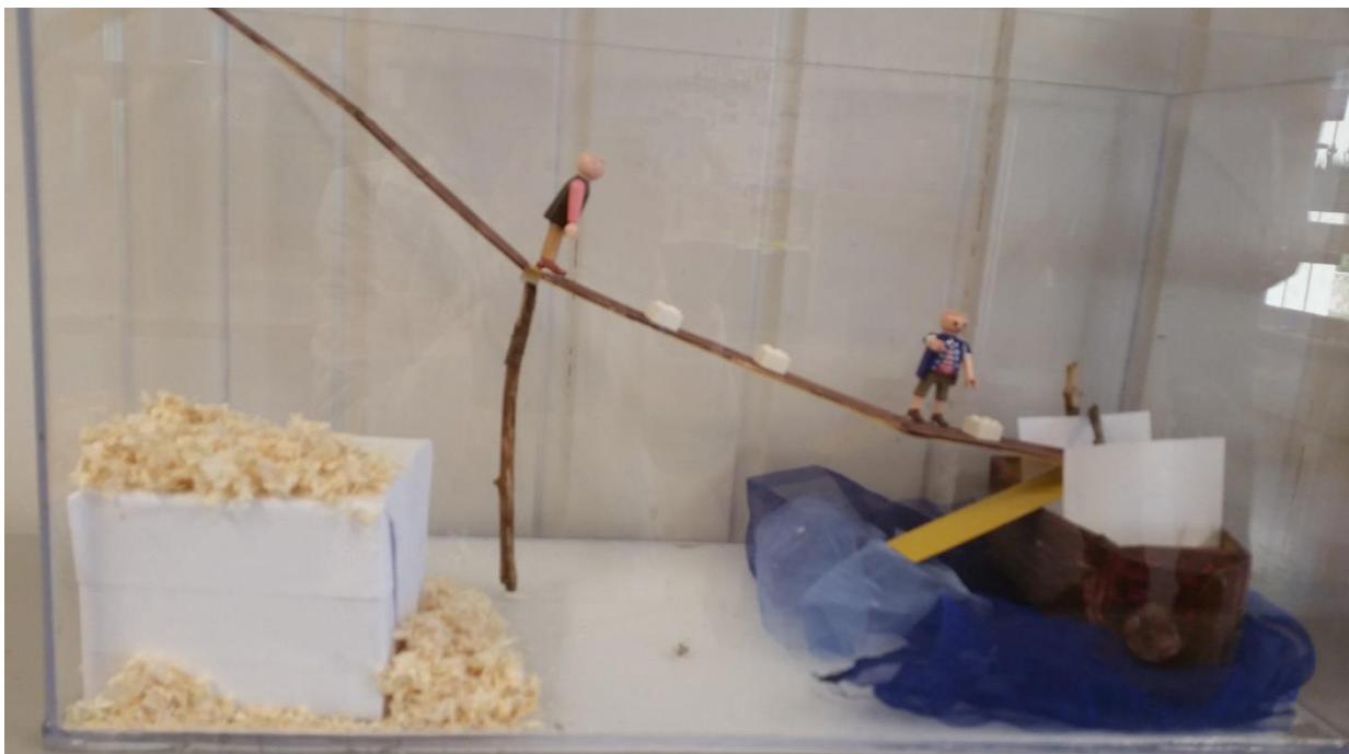
Transport av is på renne ned til frakteskute

Resultatene av barnas arbeid og refleksjoner blir vist på Kystkulturdagen 15.juni. Vi vil også trekke frem noe på Kystkulturkvelden på Halen gård tirsdag 11.juni.